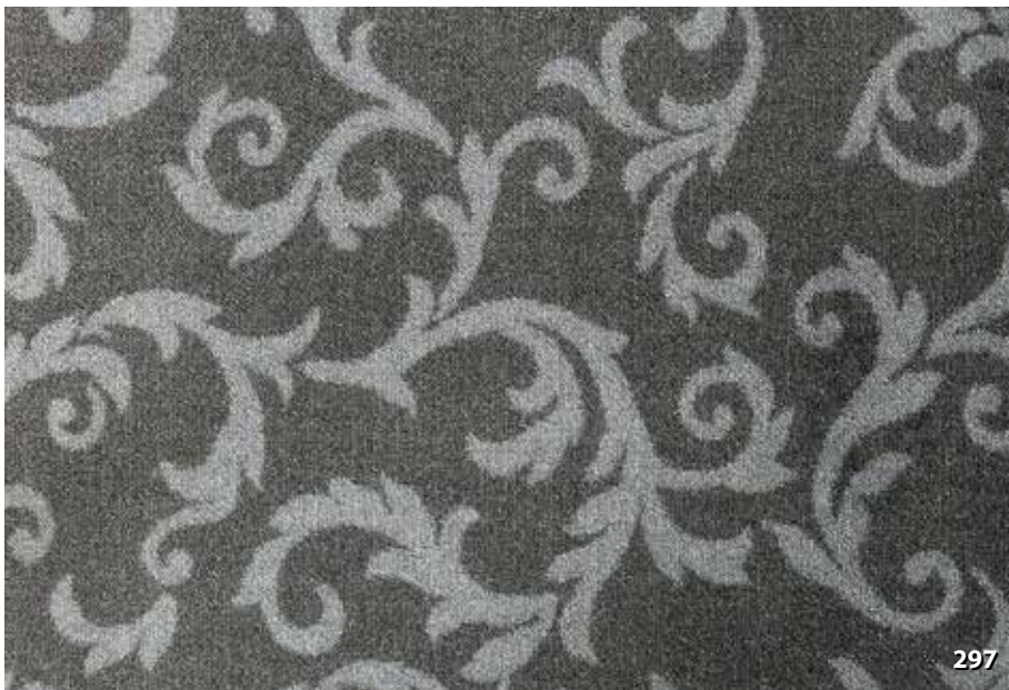
Dim. Altezze cm. 67/80/100/120/200