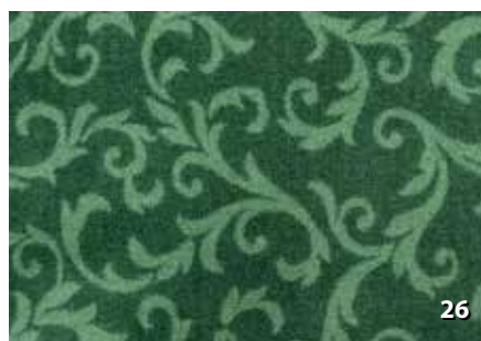
Dim. Altezze cm. 67/80/100/120/200