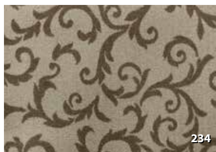
Dim. Altezze cm. 67/80/100/120/200