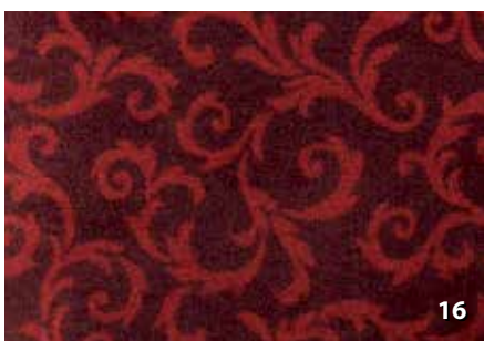
Dim. Altezze cm. 67/80/100/120/200